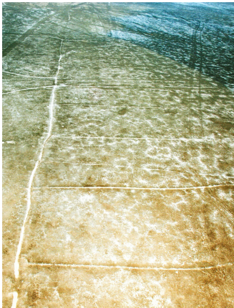
Рисунок В.22 – Аэрофотосъемка пересохшего дна Арала (по К.М. Байпакову)