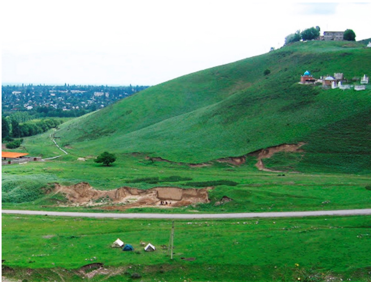
Рисунок В.1 – Раскопки стоянки Майбулак (по Ж.К. Таймагамбетову)