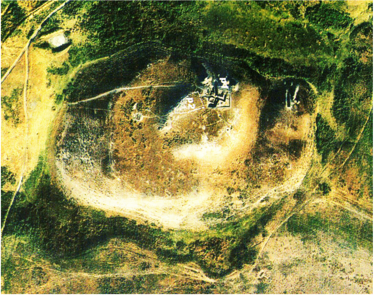
Рисунок В.19 – Городище Сидак (по Е.А. Смагулову)