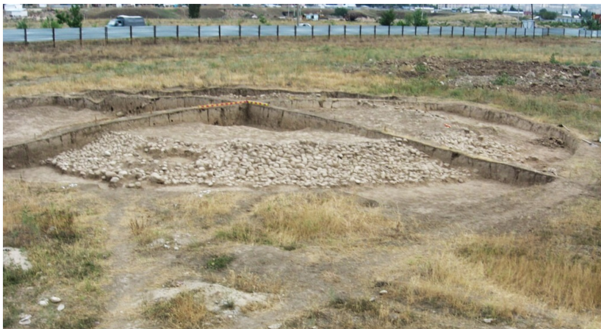
Рисунок В.3 – Исследование курганов Улжан (по Ж.Е. Смаилову)