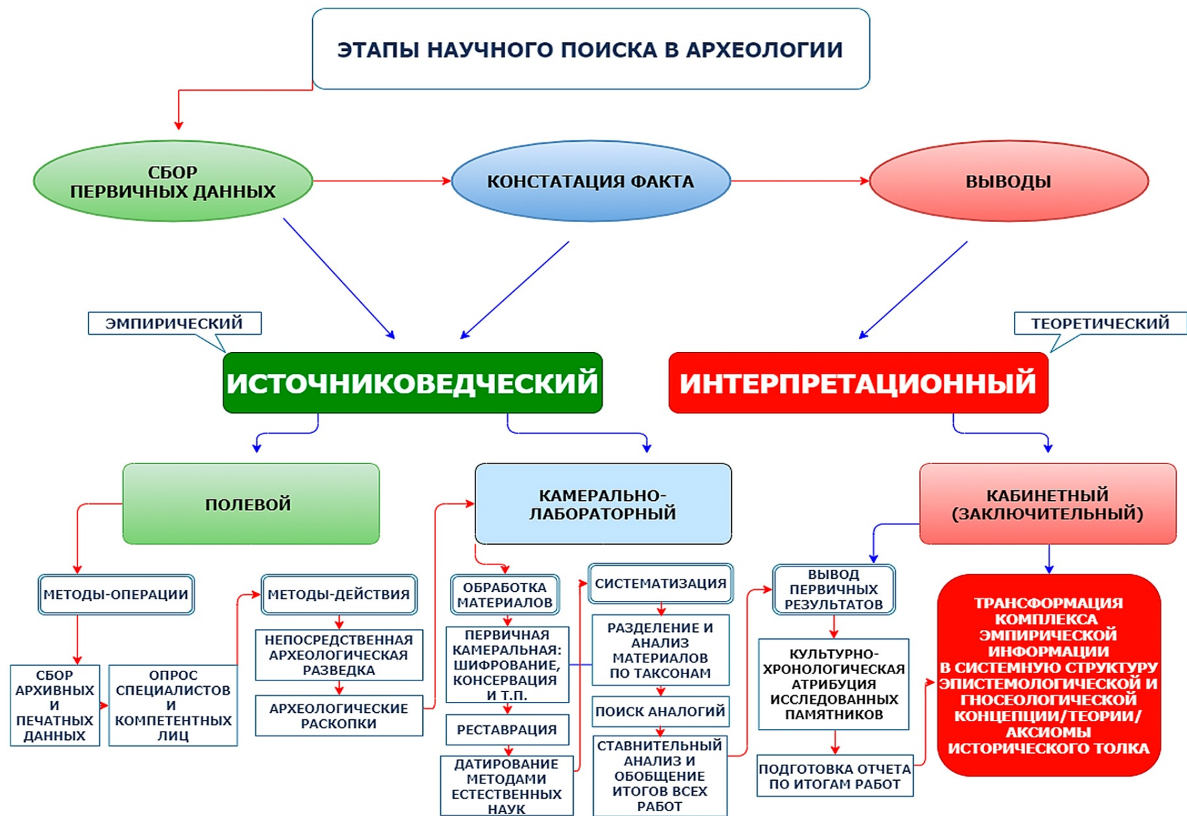
Рисунок А.4 – Этапы и порядок научного поиска в археологии