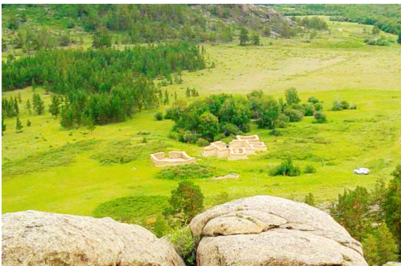
Рисунок В.28 – Поселение Кент