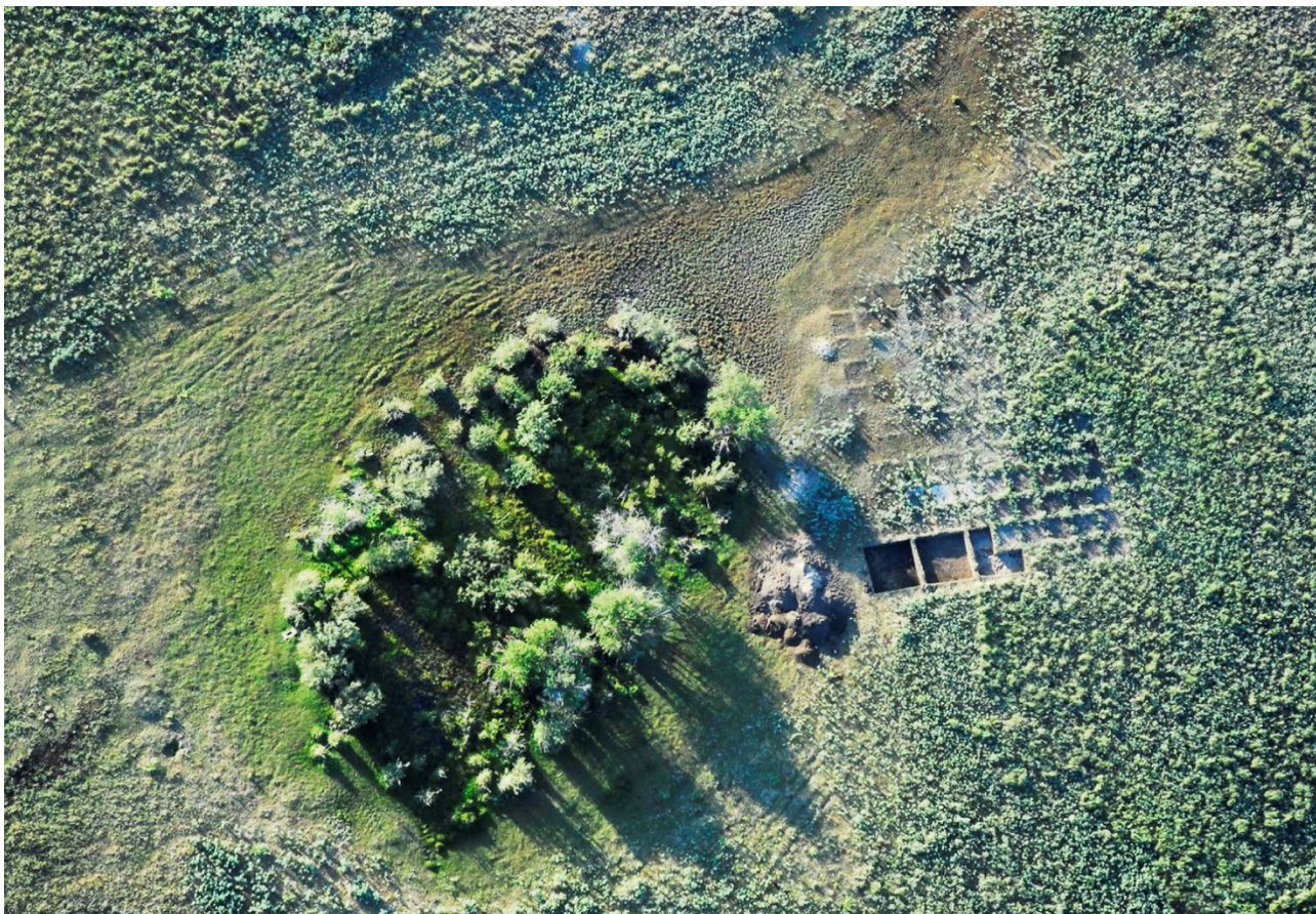
Рисунок В.25 – Раскопки стоянки Токтауыл (по О.А. Артюховой)