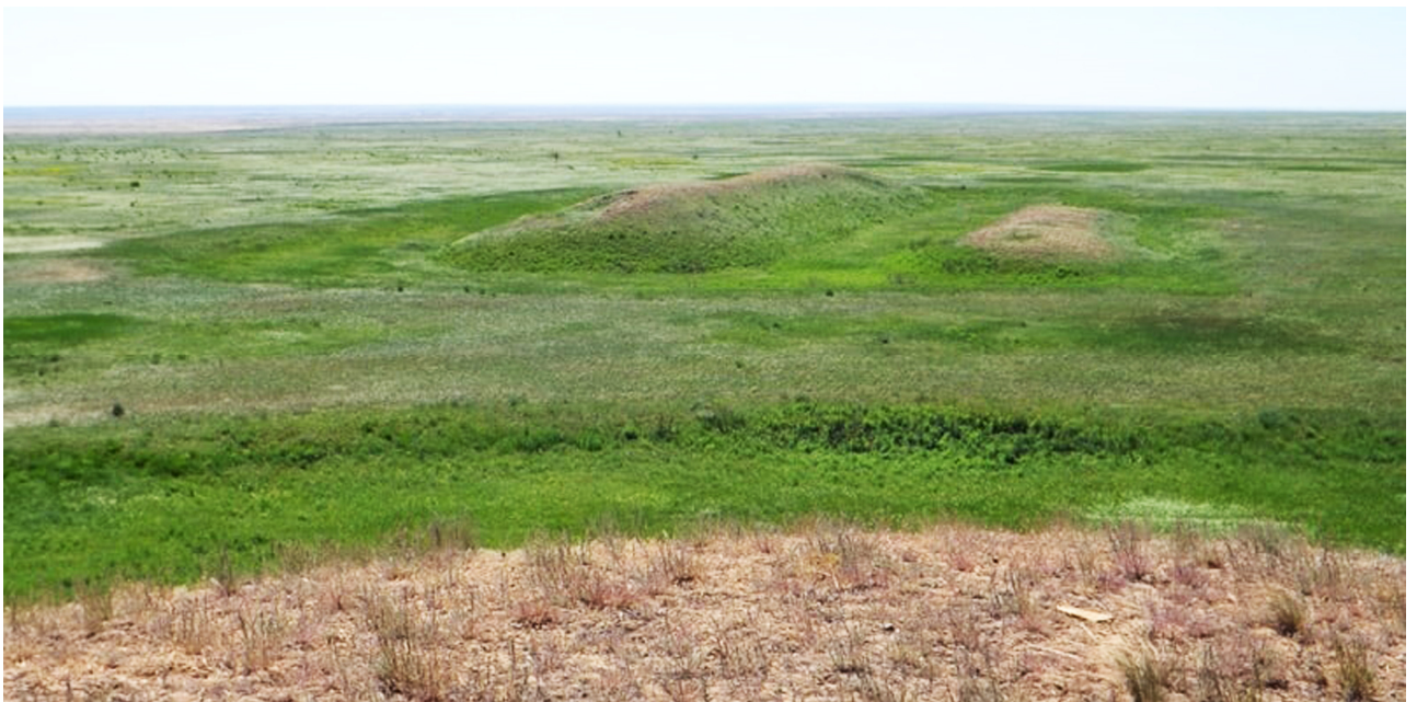
Рисунок В.36 – Могильник Кырык Оба (по М. Калменову)