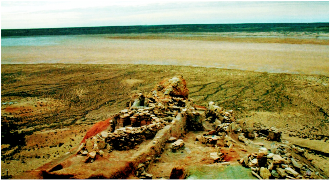
Рисунок В.41 – Поселение Токсанбай (по З. Самашеву и Т.Н. Лошаковой)