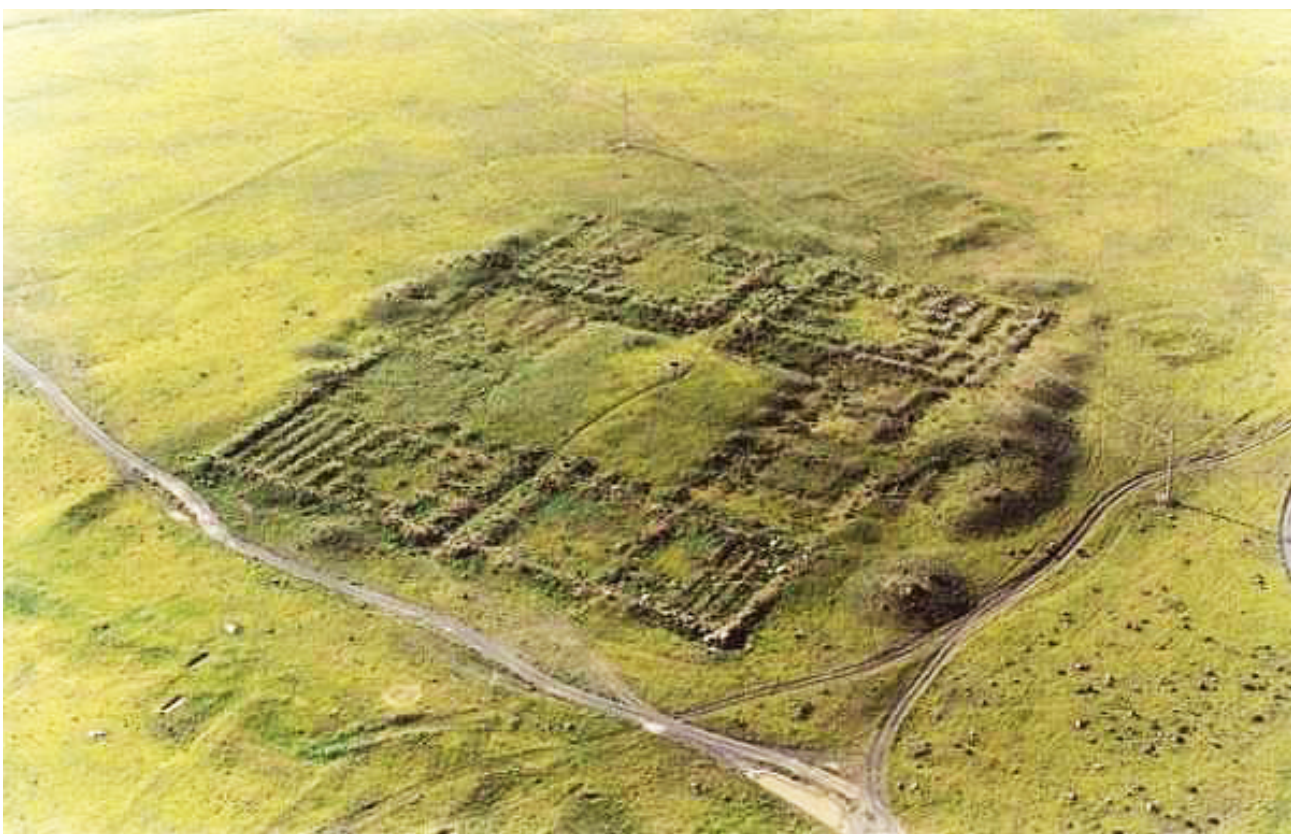
Рисунок В.12 – Комплекс Акыртас (по К.М. Байпакову)