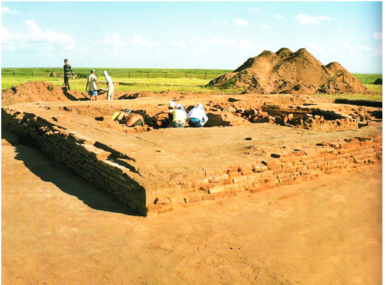
Рисунок В.35 – Раскопки на памятнике Аулиеколь (по Т.Н. Смагулову)