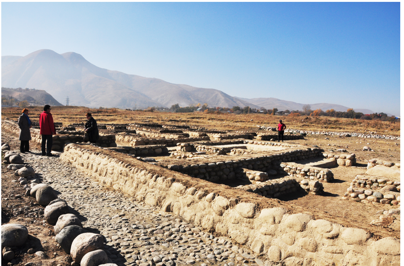
Рисунок В.6 – Городище Талгар (по Т.В. Савельевой)