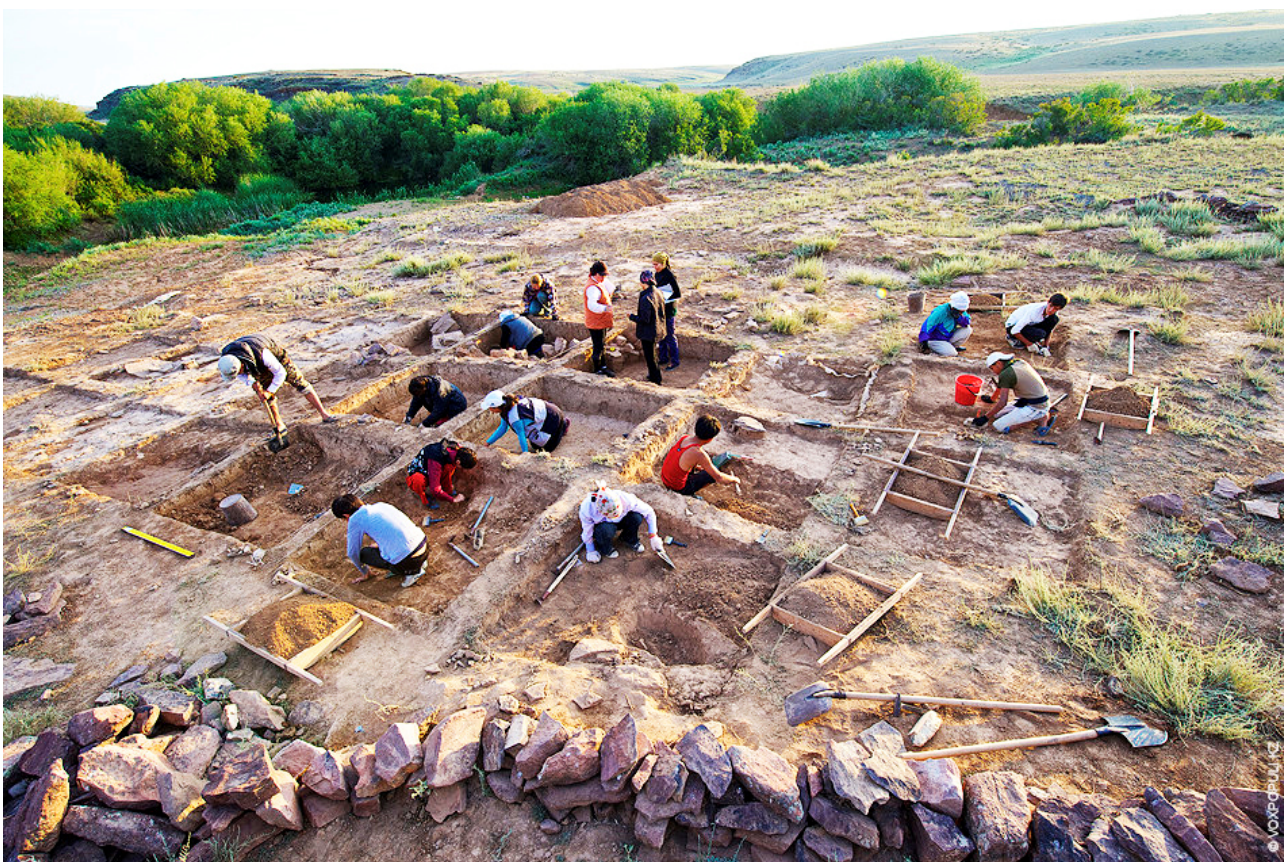
Рисунок В.26 – Раскопки поселения Талдысай (по А.С. Ермолаевой)