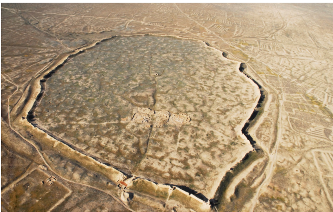
Рисунок В.18 – Городище Сауран (по ГИКЗМ «Азрет Султан»)