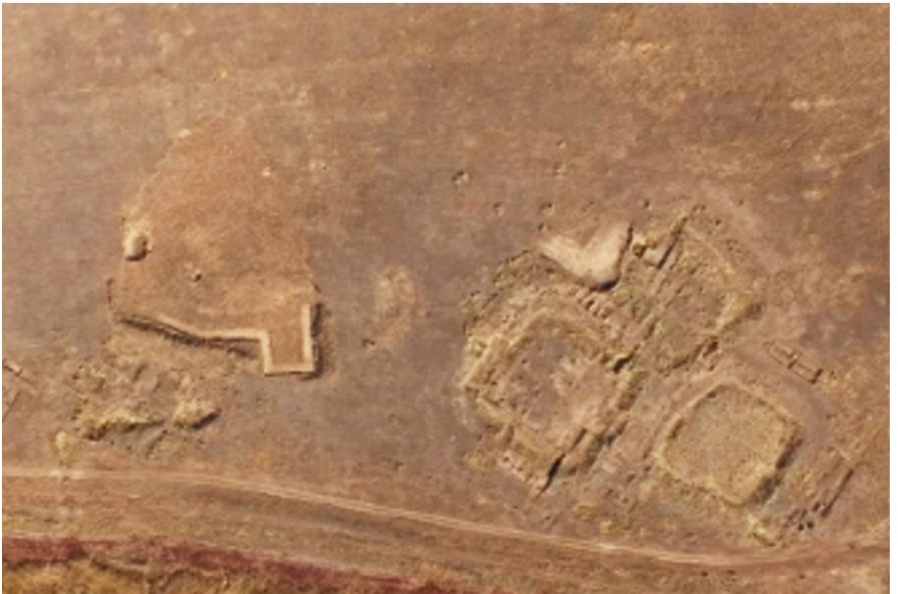
Рисунок В.31 – Городище Бозок (по М.К. Хабдулиной)