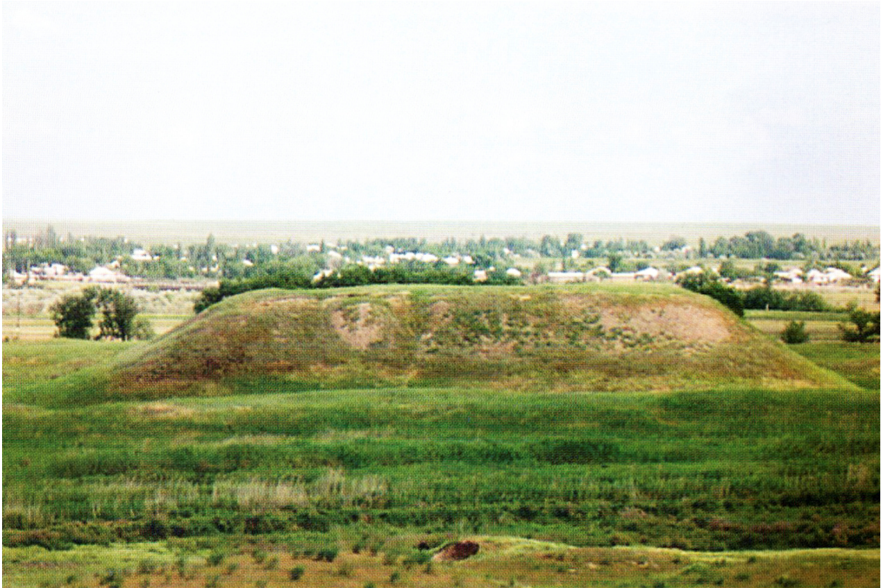
Рисунок В.15 – Городище Жуантобе (по К.М. Байпакову)