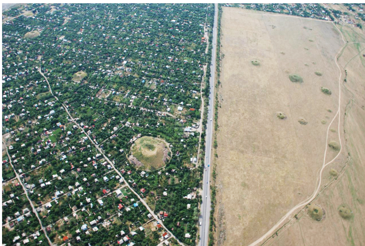
Рисунок В.4 – Иссыкские курганы (по Б.Н. Нурмуханбетову)