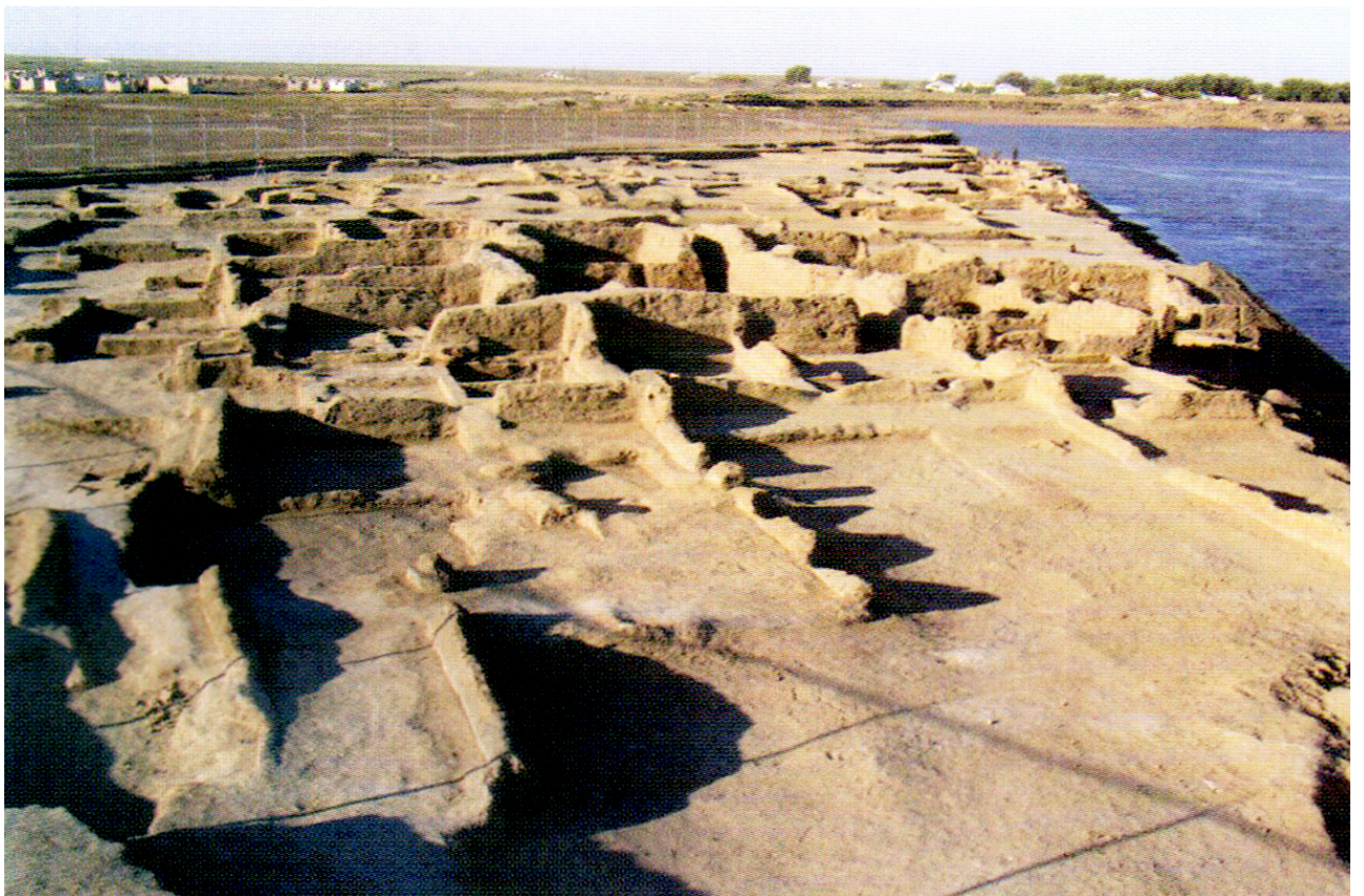
Рисунок В.40 – Городище Сарайшык (по З. Самашеву)