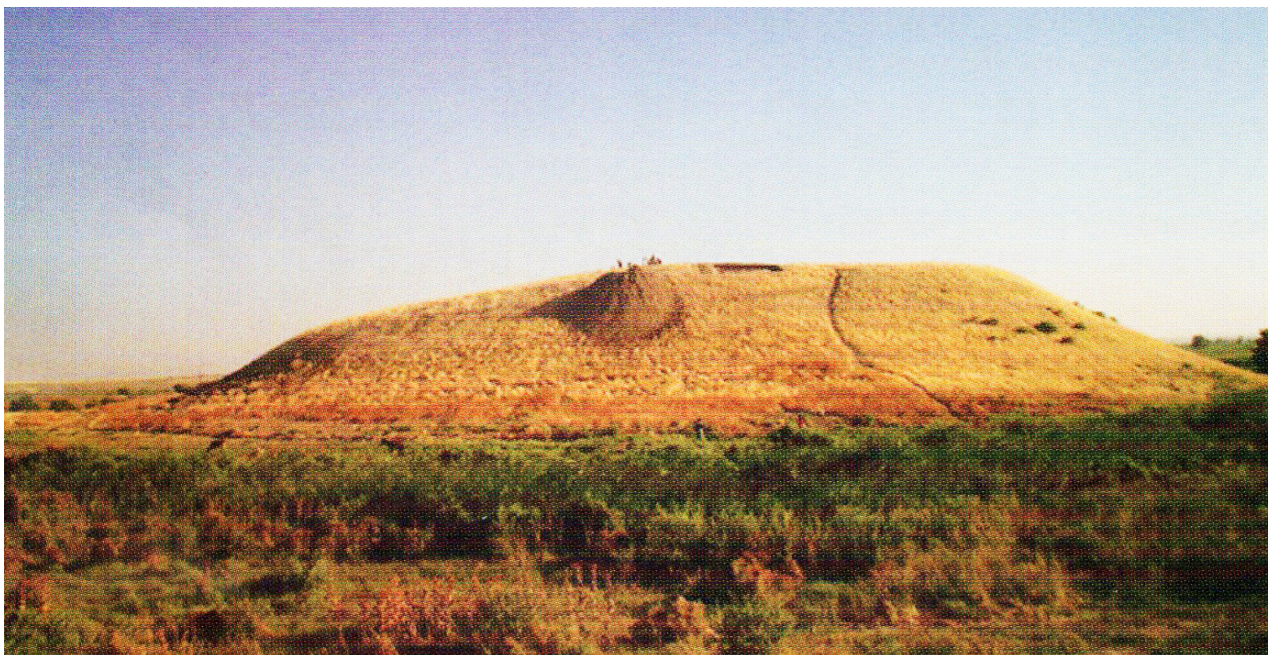
Рисунок В.16 – Городище Караспантобе (по К.М. Байпакову)