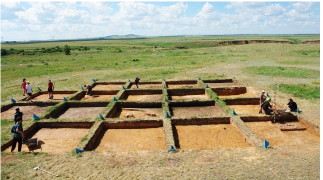
Рисунок В.32 – Раскопки поселения Ботай (по В.Ф. Зайберту)