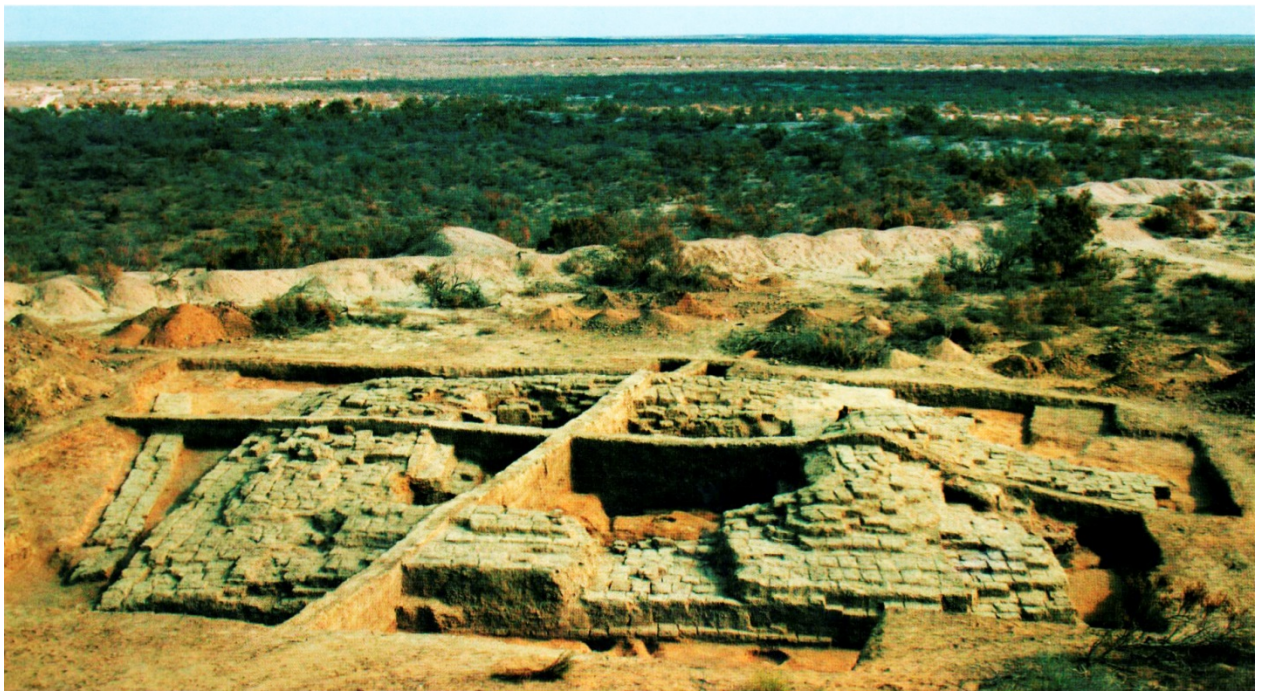
Рисунок В.23 – Раскопки городища Чирик Рабат (по Ж.К. Курманкулову)