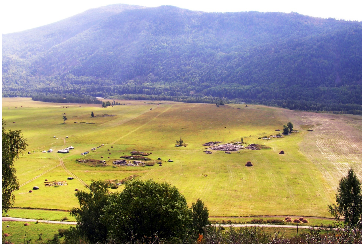
Рисунок В.8 – Берельские курганы (по З. Самашеву)