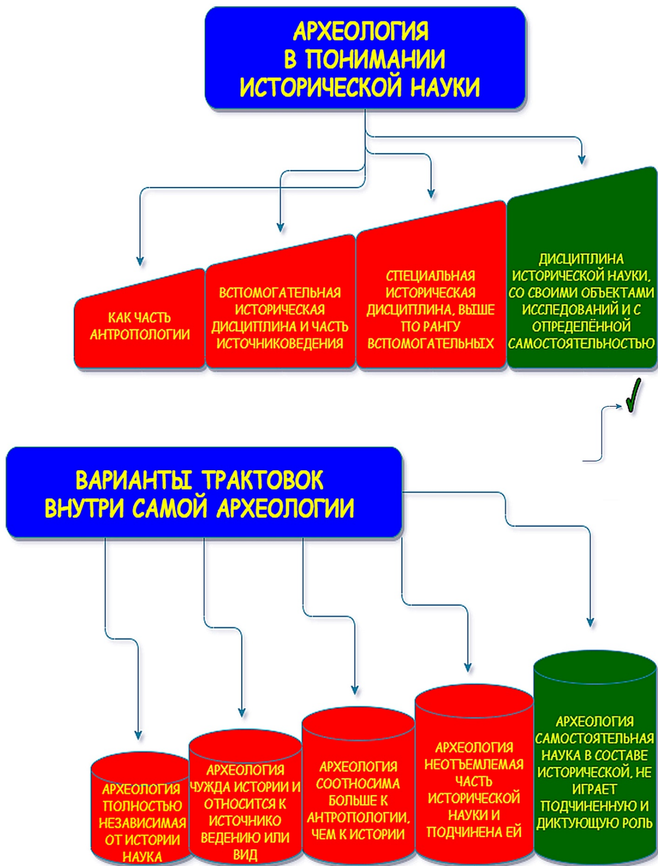
Рисунок А.3 – Варианты трактовки археологии в исторической науке