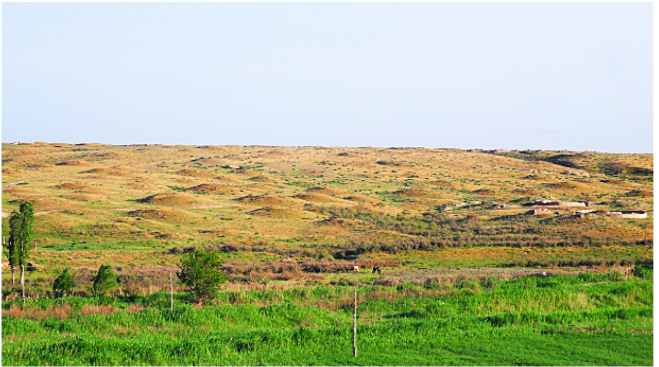
Рисунок В.21 – Некрополь Борижары (по Е.А. Смагулову)