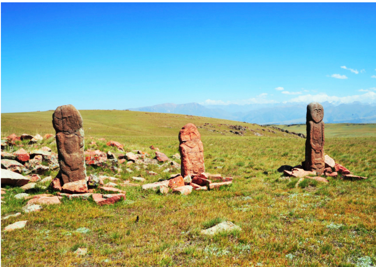
Рисунок В.11 – Тюркское святилище Мерке (по А.М. Досымбаевой)