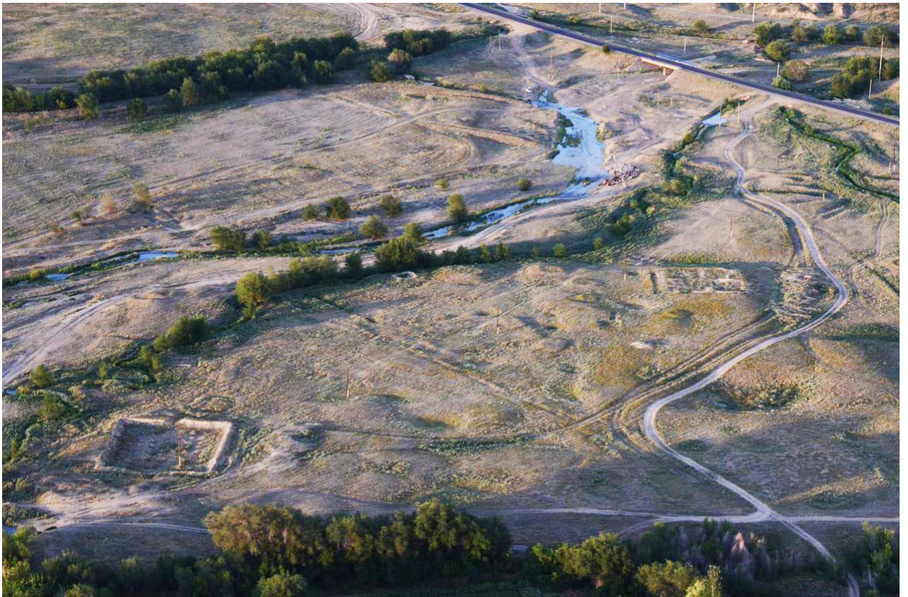
Рисунок В.5 – Городище Койлык (по К.М. Байпакову)