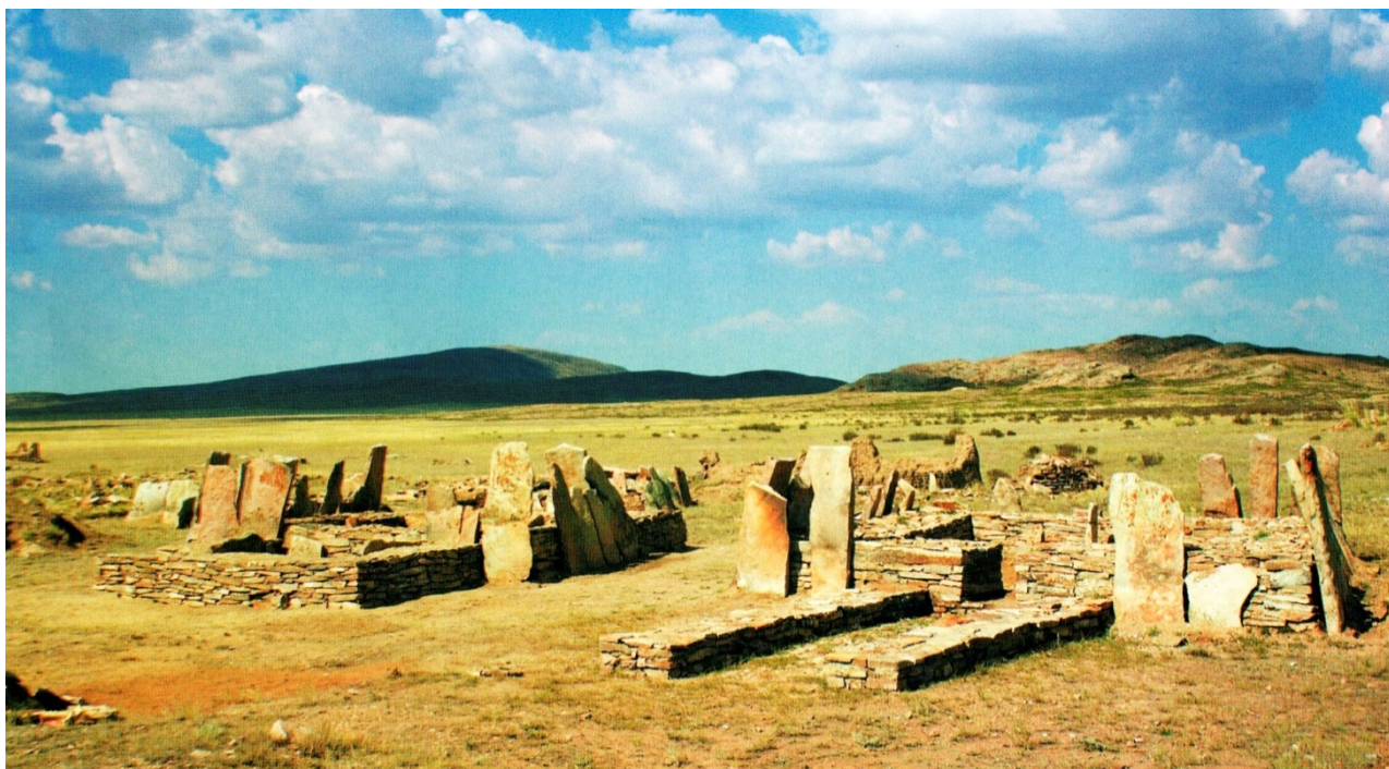
Рисунок В.29 – Некрополь Бегазы (по А.З. Бейсенову)