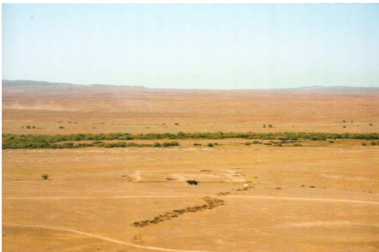
Рисунок В.30 – Городище Хан Ордасы (по Г.А. Ахатову)