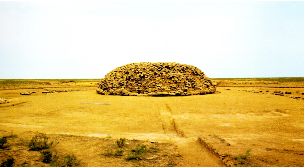
Рисунок В.38 – Главное культовое сооружение святилища Кызыл Уик (по З. Самашеву)