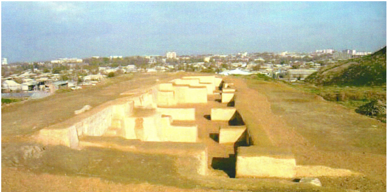
Рисунок В.20 – Раскопки городища Шымкент (по Б.А. Байтанаеву)