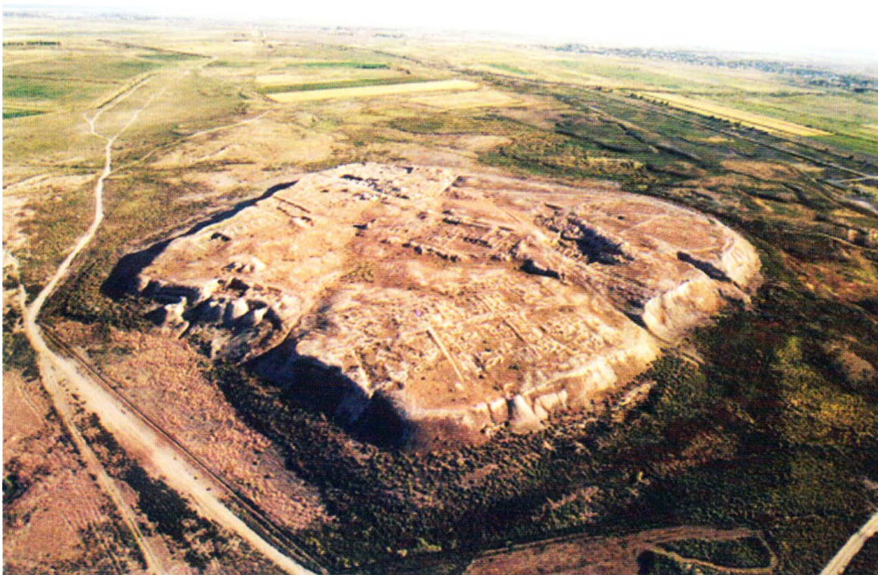
Рисунок В.17 – Городище Оттырар (по К.М. Байпакову)