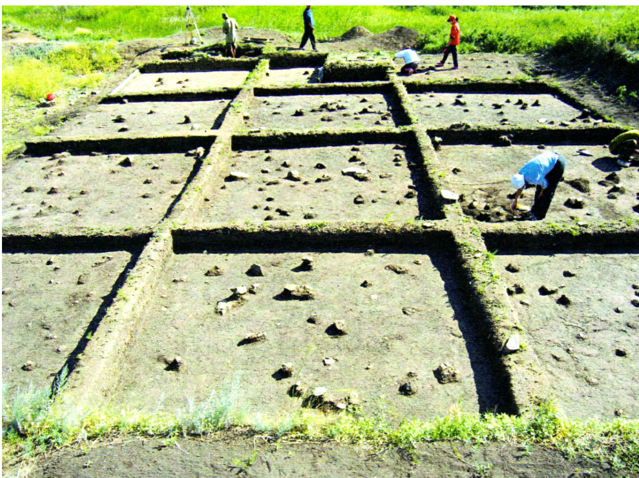
Рисунок В.34 – Раскопки стоянки Шидерты 3 (по В.К. Мерц)