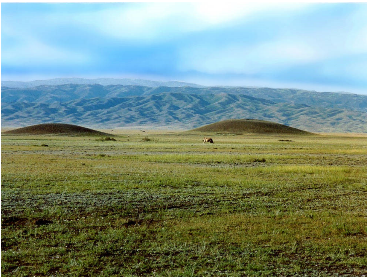
Рисунок В.7 – Шиликтинские курганы (по А.Т. Толеубаеву)