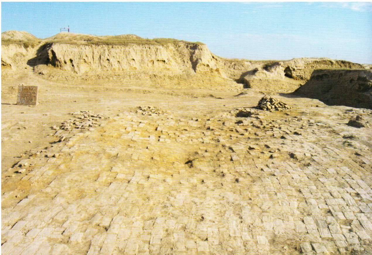
Рисунок В.13 – Раскопки городища Актобе (Баласагун) (по У.Х. Шалекену)