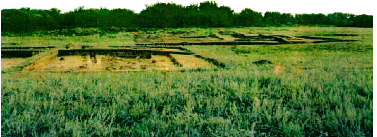
Рисунок В.37 – Городище Жайык (по Г.А. Ахатову)