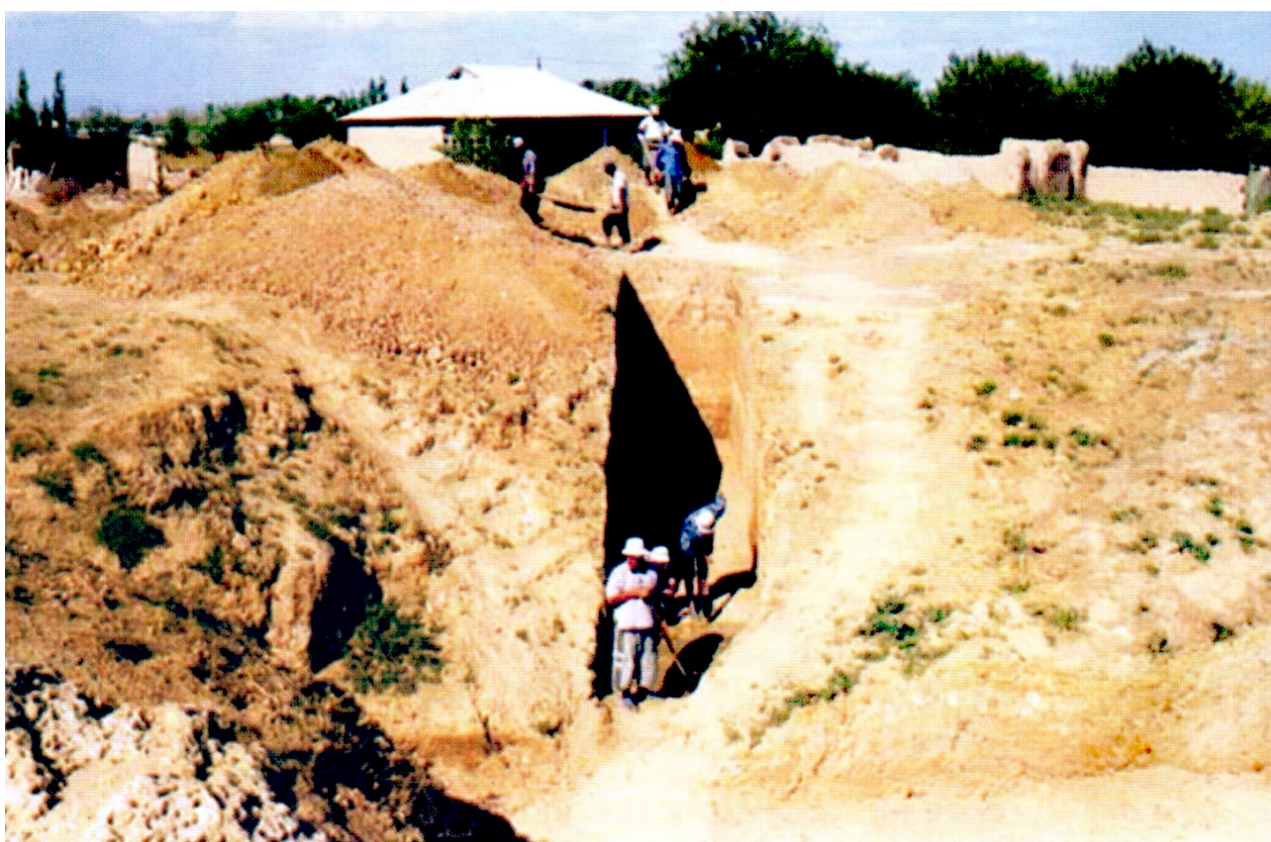
Рисунок В.14 – Раскопки стоянки Кошкурган (по Ж.К. Таймагамбетову)