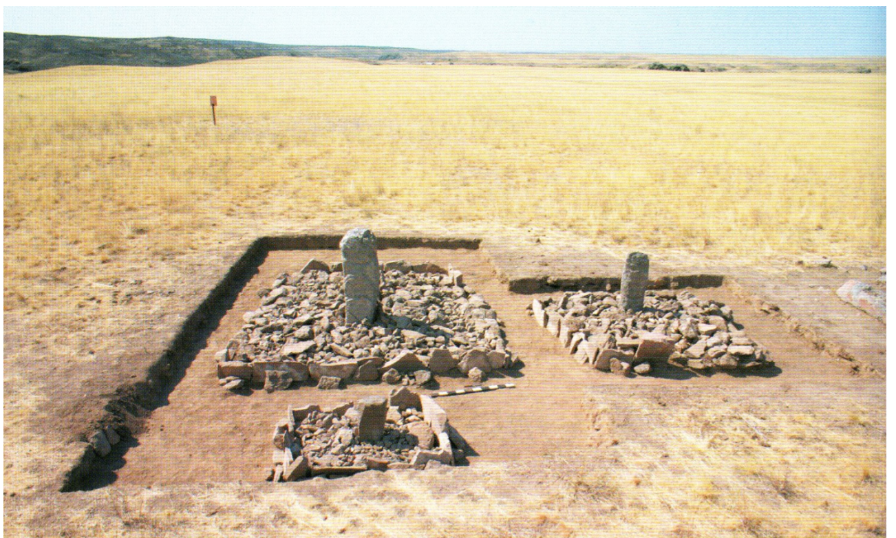
Рисунок В.10 – Раскопки тюркского святилища Жайсан (по А.М. Досымбаевой)