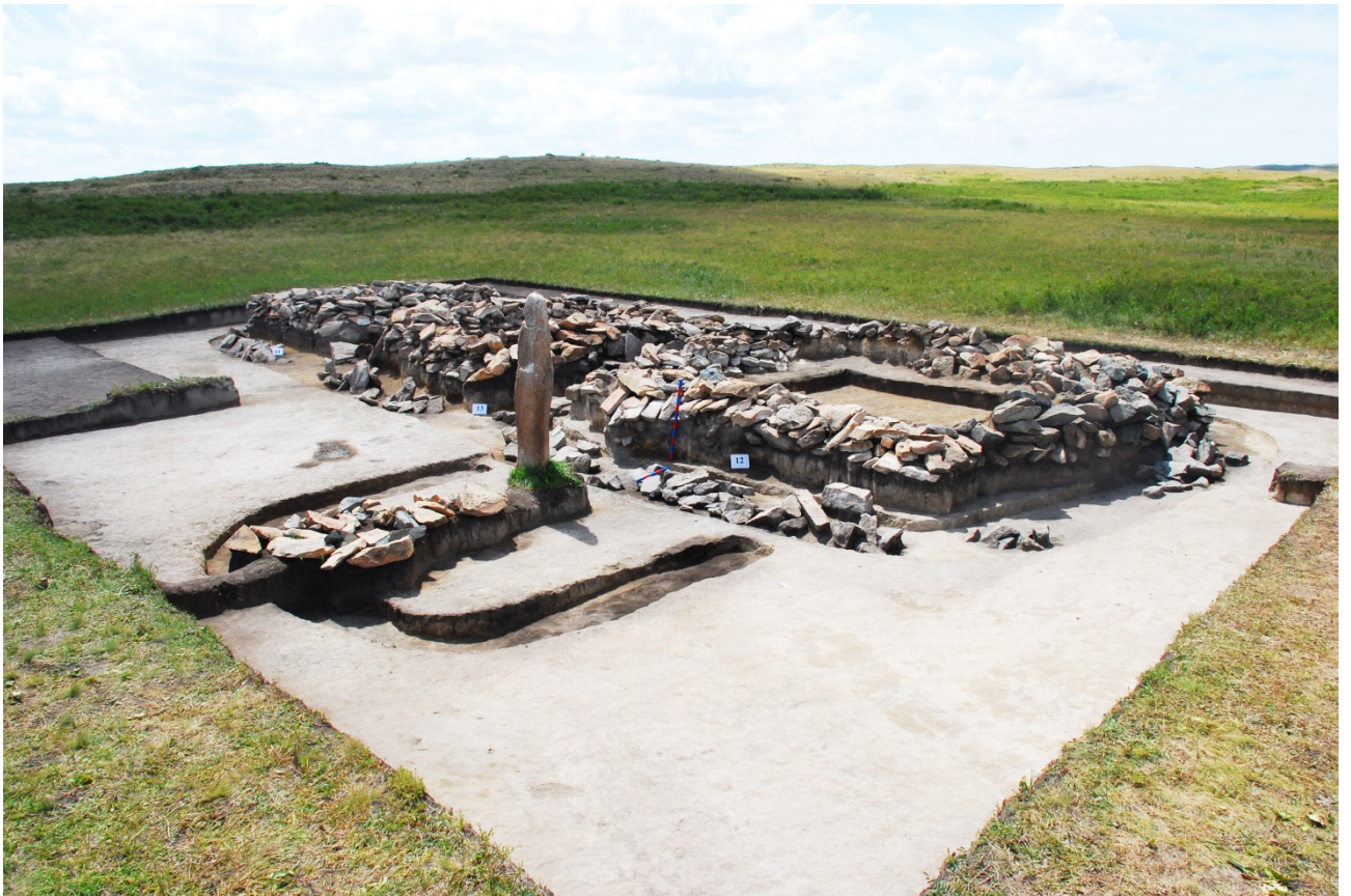
Рисунок В.9 – Раскопки тюркского комплекса Сарыколь (по З. Самашеву)