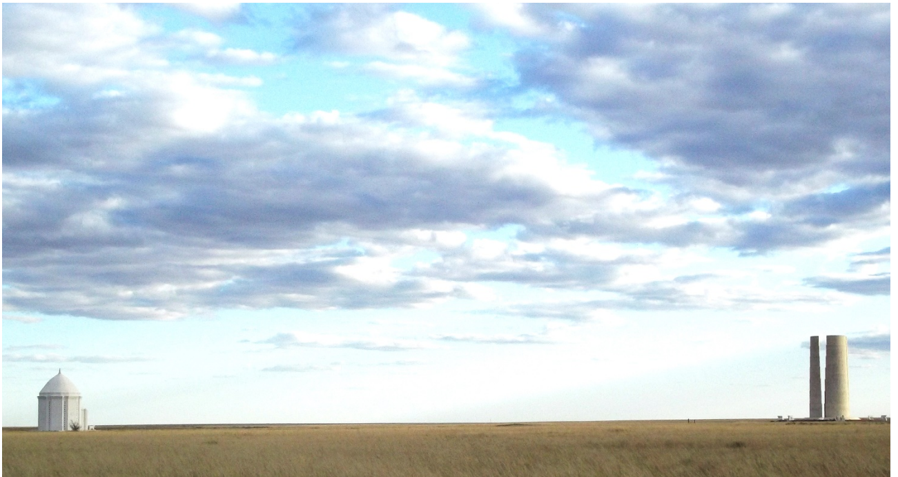
Рисунок В.39 – Мемориальный комплекс Хан Моласы (по С.Е. Ажигали)