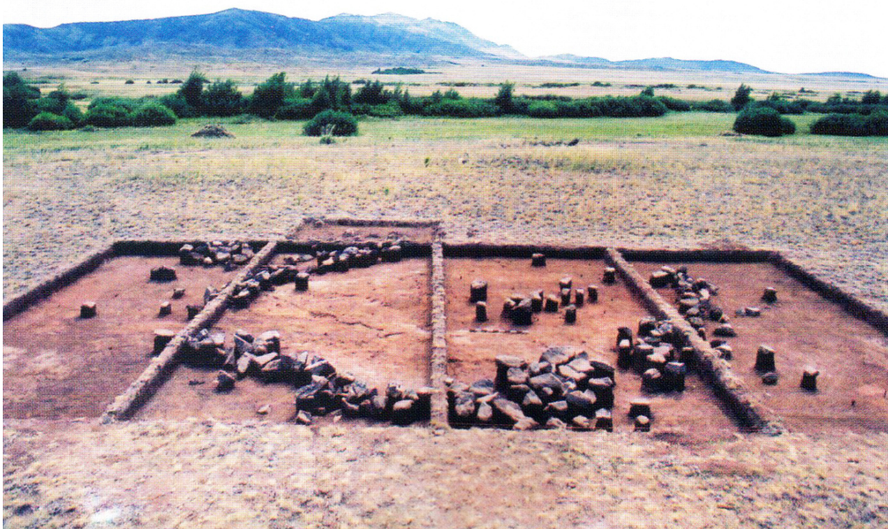
Рисунок В.27 – Раскопки памятника Айбас Дарасы (по Ж.К. Курманкулову)