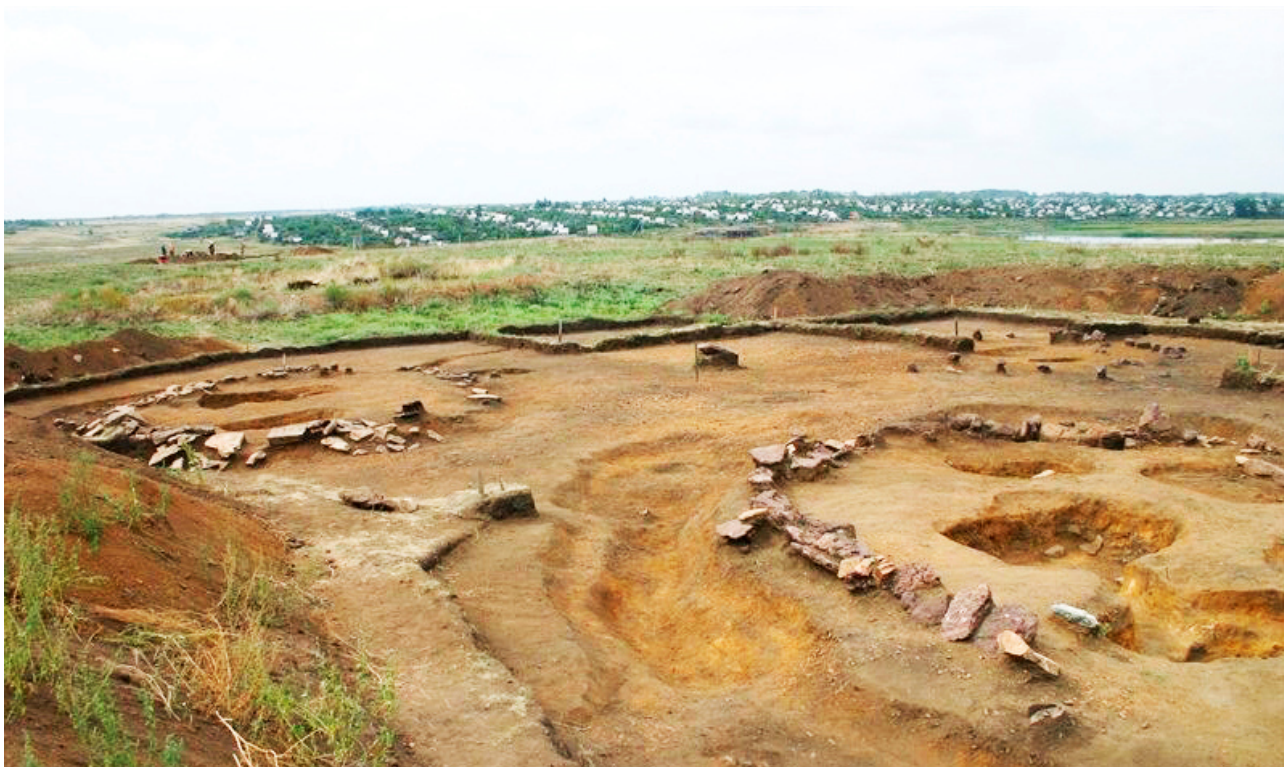
Рисунок В.33 – Могильник Бестамак (по А.В. Логвину)