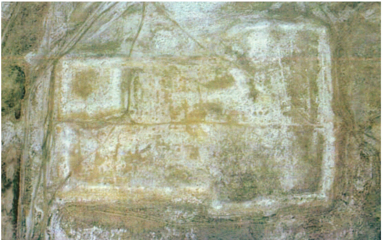
Рисунок В.24 – Аэрофотосъемка городища Жанкент (по К.М. Байпакову)